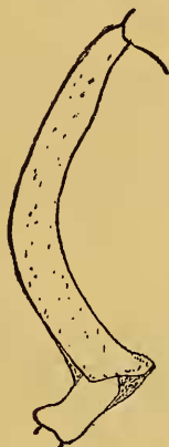
Abb. 11. Vorderschiene von nitens .